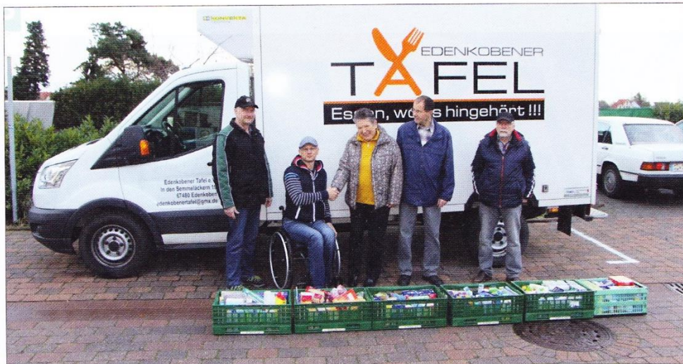
Der Schützenverein Edesheim spendet gern für die Edenkobener Tafel.

Mit dieser Spendenaktion versuchen der Schützenverein und die Tafel ein Stück weit die Lebensqualität der sozial und wirtschaftlich Benachteiligten in Edenkoben zu verbessern. Unter dem Leitspruch: „Jeder gibt, was er kann“ sammeln die Mitglieder des Edesheimer Schützenvereins und versu-